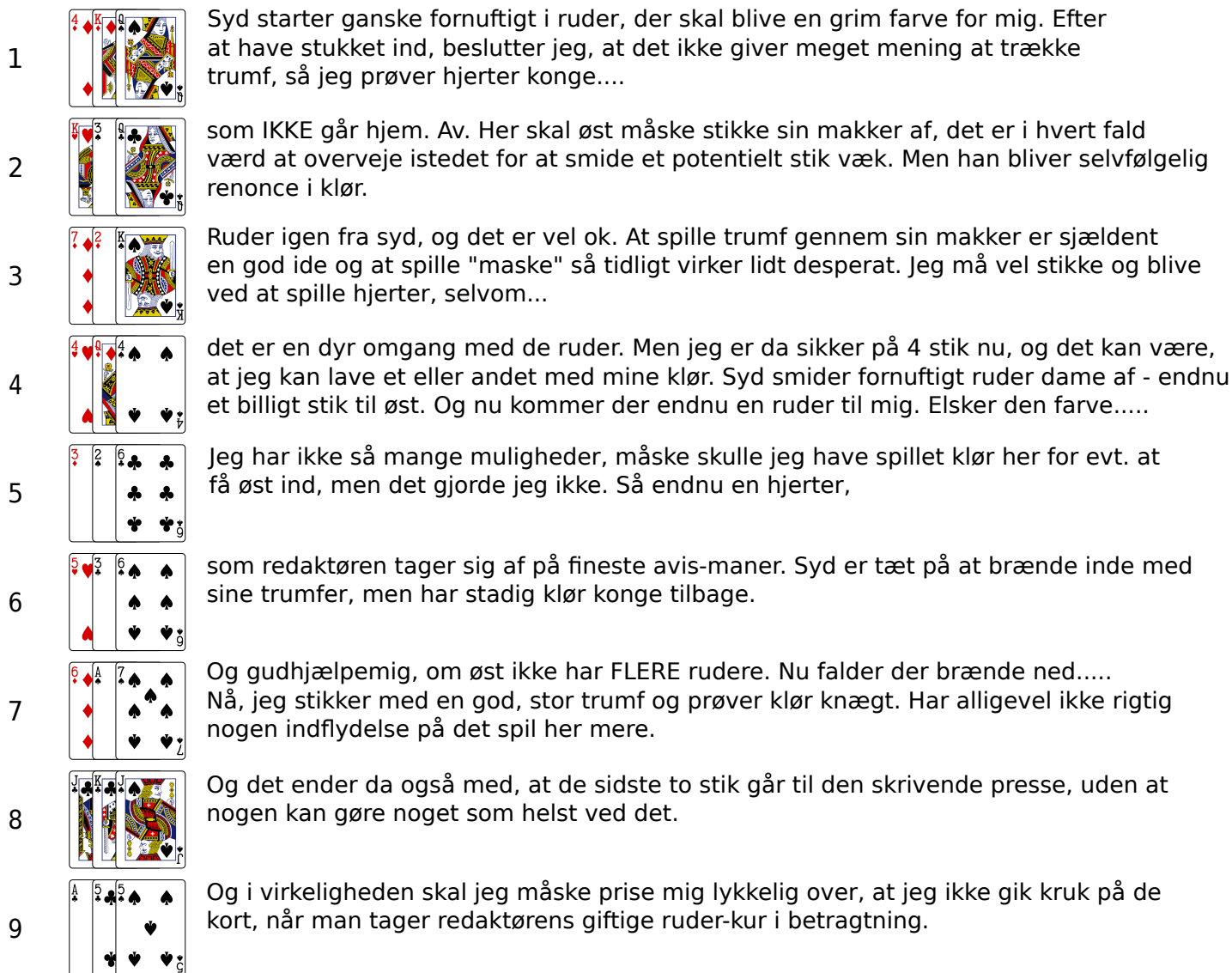
"Degnen" (Nord) - Solo spar