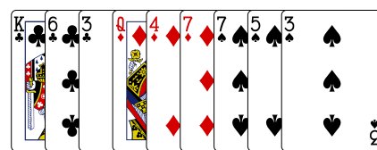
"Munken" (Syd) - udspil